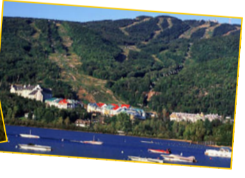
Parc National du Mont-Tremblant

Pour ceux qui aiment jouir de la vie à un rythme ralenti, le printemps est la période idéale pour visiter Tremblant... profiter du village, des aubaines de magasinage de fin de saison d'équipement de ski ou de vêtements mode, n'ayant pas à se bousculer parmi les touristes saisonniers aux meilleurs restos de la ville, être les premiers à relaxer sur les terrasses nouvellement ouvertes